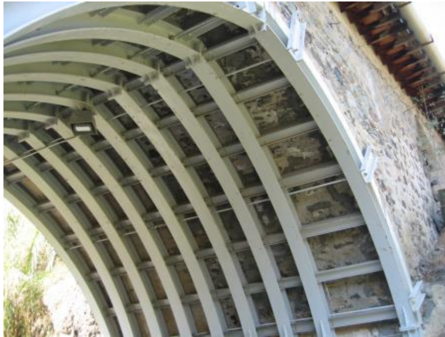
Μεταλλική στήριξη των γεφυριών